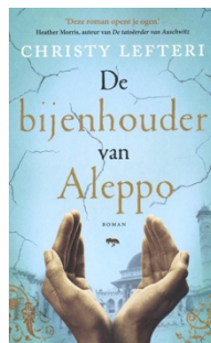
Christy Lefteri Bijenhouder van Aleppo Mozaïek, 2019 335 pagina's