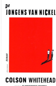
Colson Whitehead De jongens van Nickel Atlas Contact, 2019 271 pagina's

Met Het Vrouwenpaleis geeft Laetitia Colombani een stem aan degenen die zelden gehoord worden, aan hun tegenslagen en zware lot, maar ook aan hun levenskracht en vrijgeheid.