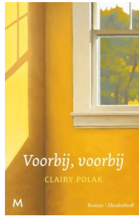
Clair Polak Voorbij, voorbij Meulenhoff, 2019 254 pagina's

De ontmoeting tussen Leo en Judith leidt tot een bijna symbiotische liefde – onverwacht, gezien hun totaal verschillende achtergrond. Vijfentwintig jaar lang kwam daar niets of niemand tussen. Tot de alzheimer zijn verwoestende werk kwam doen. Zowel Leo als Judith valt ten prooi aan grote verwarring. Leo's verleden dreigt radicaal te worden uitgegumd, terwijl Judith probeert hun gezamenlijke leven aan de vergetelheid te ontrukken en haar eigen toekomst opnieuw vorm te geven. Met de moed der wanhoop en een flinke dosis zelfspot probeert ze het hoofd boven water te houden. Aan de hand van Leo's verhalen over zijn jeugd en haar eigen herinneringen probeert ze de steeds vager wordende foto van Leo's leven weer wat diepte te geven en daarmee een basis te leggen om door te gaan.