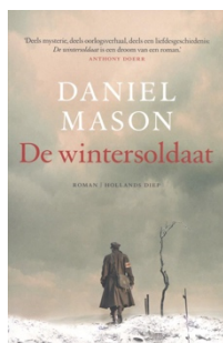
Daniel Mason De wintersoldaat Hollands Diep, 2019 365 pagina's

Christy Lefteri (1980) is geboren en getogen in Londen. Ze is de dochter van Grieks-Cypriotische vluchtelingen en werkte als vrijwilliger in het Unicef-opvangcentrum voor vluchtelingen in Athene, waar het idee voor De bijenhouder van Aleppo geboren werd.