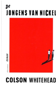
Colson Whitehead De jongens van Nickel Atlas Contact, 2019 271 pagina's

Met Het Vrouwenpaleis geeft Laetitia Colombani een stem aan degenen die zelden gehoord worden, aan hun tegenslagen en zware lot, maar ook aan hun levenskracht en vrijgeheid.