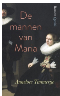
Anneloes Timmerije De mannen van Maria Querido, 2019 344 pagina's

"We gingen om te baren, verscheept op bestelling van de heren ginds, zeven meisjes die vaak nog niet eens waren gekust."